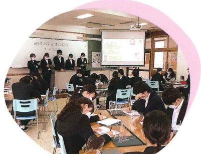
実習まとめ発表会