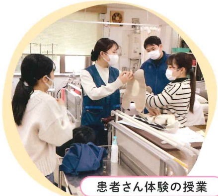
患者さん体験の授業