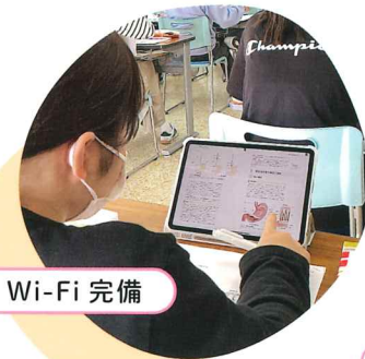
各教室 Wi-Fi 完備