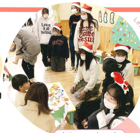
クリスマスイベント