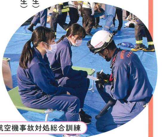
航空機事故対処総合訓練